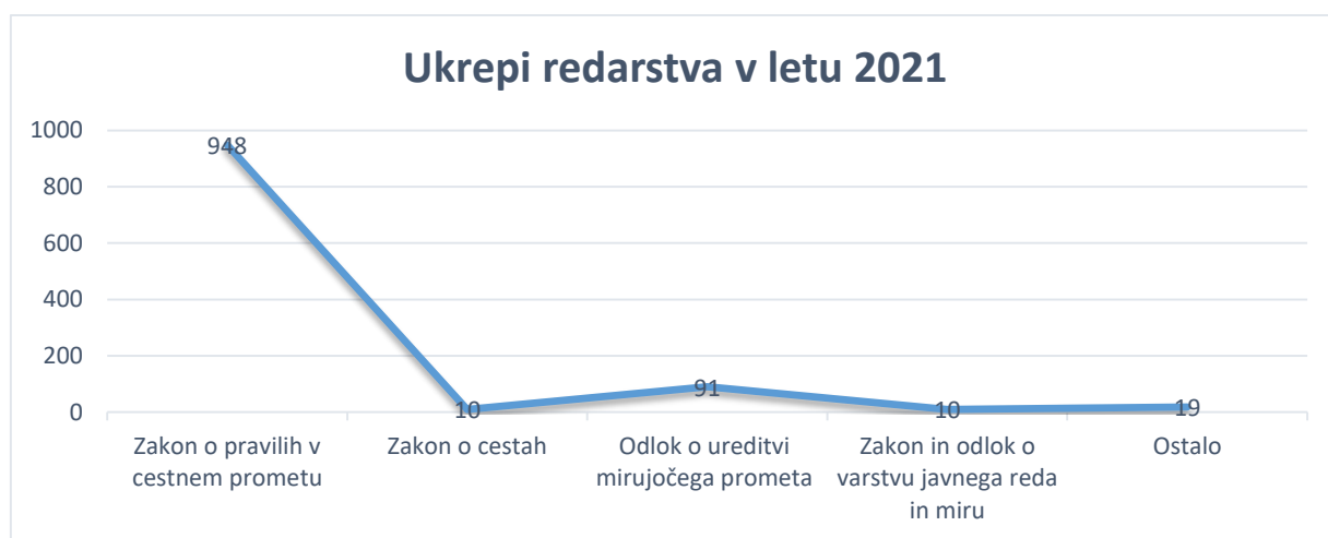
Graf 1: Ukrepi redarstva v letu 2021

V letu 2023 smo 12-krat izvedli nadzor prekoračitve hitrosti s samodejnimi merilnimi napravami. Glavni namen nadzora hitrosti je umiritev ter zmanjševanje hitrosti in s tem povečati varnost vseh udeležencev v prometu. Lokacije določamo tudi na podlagi pobud občanov oziroma s pomočjo »tabel VI VOZITE«, ki spremljajo statistiko prekoračitev na lokacijah kjer so postavljene, ter na pobudo sveta za preventivo in varnost v cestnem prometu.